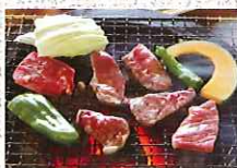
大川黒牛のバーベキュー

大川村は黒牛の産地。白滝の里でも、放牧された牛たちがのんびりと草を食む風景に出会えます。コクがあり火を通して柔らかいこの黒牛を、白滝里の茶屋では炭火焼きバーベキューで特性タレをつけて味わえます。また、メニューには、大川黒牛の牛丼やはちきん地鶏カレーもありますので、ぜひご賞味ください。