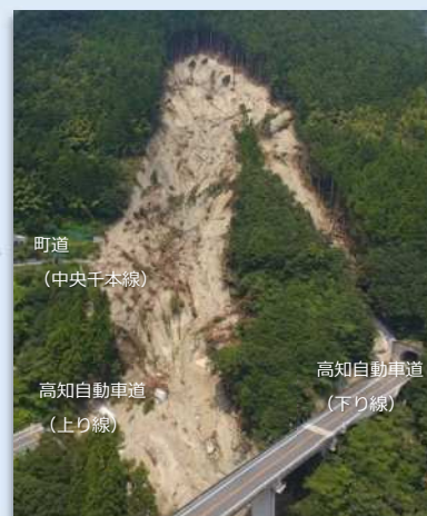
大豊町立川千本で発生した山腹崩壊（平成30年7月撮影）